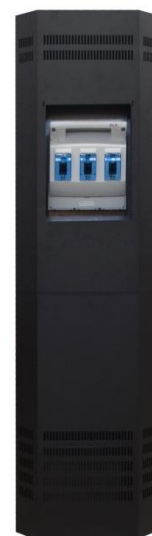
Стеллаж с блоком предохранителей 630 А