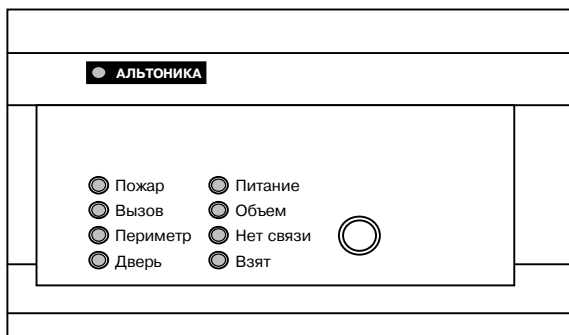
Рисунок 1 – Внешний вид приемника

Приемник имеет 9 индикаторных светодиодов (см. рисунок 1), разделенных по назначению на несколько групп.